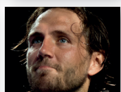
LUCAS POUILLE 2021