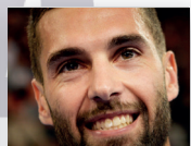
BENOÎT PAIRE 2015