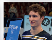
UGO HUMBERT 2019