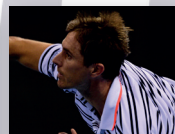
EDOUARD ROGER-VASSELIN 2015