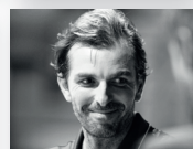
JULIEN BENNETEAU 2016 & 2018