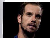
RICHARD GASQUET 2021