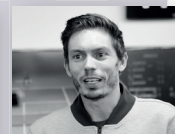
NICOLAS MAHUT 2015 & 2018